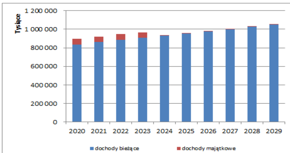
Dynamika dochodów w latach 2020-2029

W latach 2020 - 2023 wzrost dochodów majątkowych wynika głównie z planowanych do otrzymania z budżetu Unii Europejskiej dotacji na realizację zadań inwestycyjnych w tym m.in. na budowę kolejnego etapu Trasy N-S, której celem jest połączenie Drogowej Trasy Średnicowej z Autostradą A-4 oraz na zagospodarowanie wód opadowych wraz z monitoringiem środowiskowym w Mieście Ruda Śląska - Chronimy krople deszczu.